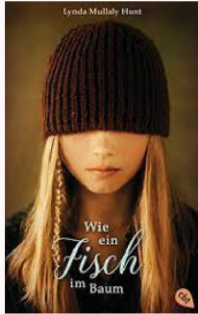
Wie ein Fisch im Baum von Aygen S Çelik, Birgit Antoni