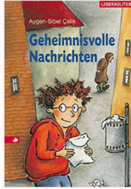
Geheimnisvolle Nachrichten von Lynda Mullaly Hunt